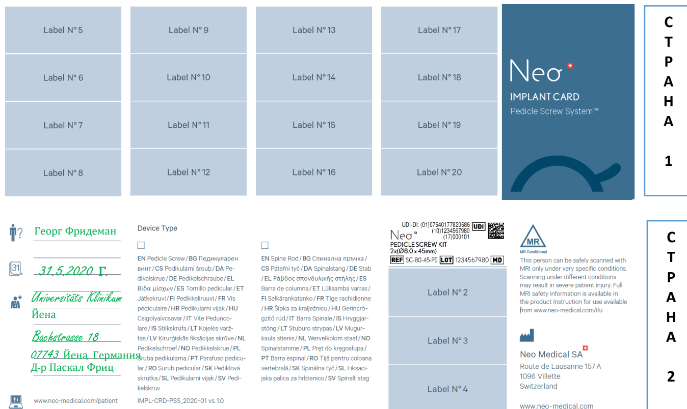
Фигура 1 - разгънати страни на картата за импланта

Neo Medical предоставя карти за имплантите, сгънати в опаковките на пръчките за Neo Pedicle Screw System™ и в опаковките на клетките за Neo Cage System™. На следващите снимки е показан пример за разгъната карта, от двете страни.